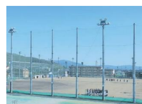
1 st Ground