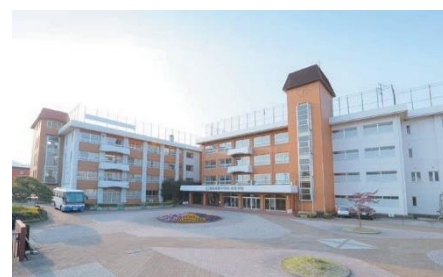
Main Building & East Wing