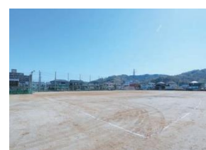
2 nd Ground